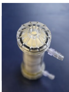
Figure 1 : Ensemble de membranes à fibres creuses et le contacteur membranaire à fibres creuses.

Les études s'orienteront selon trois axes : i) le choix de l'extractant sélective adapté au metal cible et du liquide ionique, et la compréhension des interactions intermoléculaires ; ii) l'étude de la stabilité et la cinétique de complexation des métaux ; iii) la mise au point d'un procédé d'intensification de l'extraction liquide-liquide fonctionnant en continu, associé à la compréhension du transfert de matière entre les phases et la modélisation du transport dans une optique de changement d'échelle, i.e. d'une configuration membranaire plane à des contacteurs à fibres creuses (Figure 1). Ces contacteurs s'appliqueront à des effluents réels, issus de l'industrie.